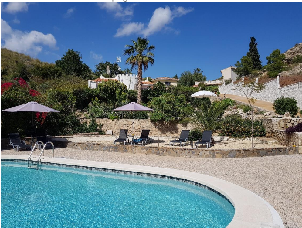
Lavinia, une perle sous le soleil espagnol.

Nous commençons en Espagne au Lavinia Resort