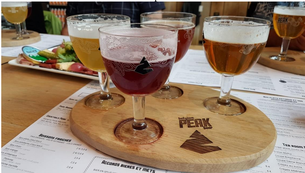
Martial en Clairette