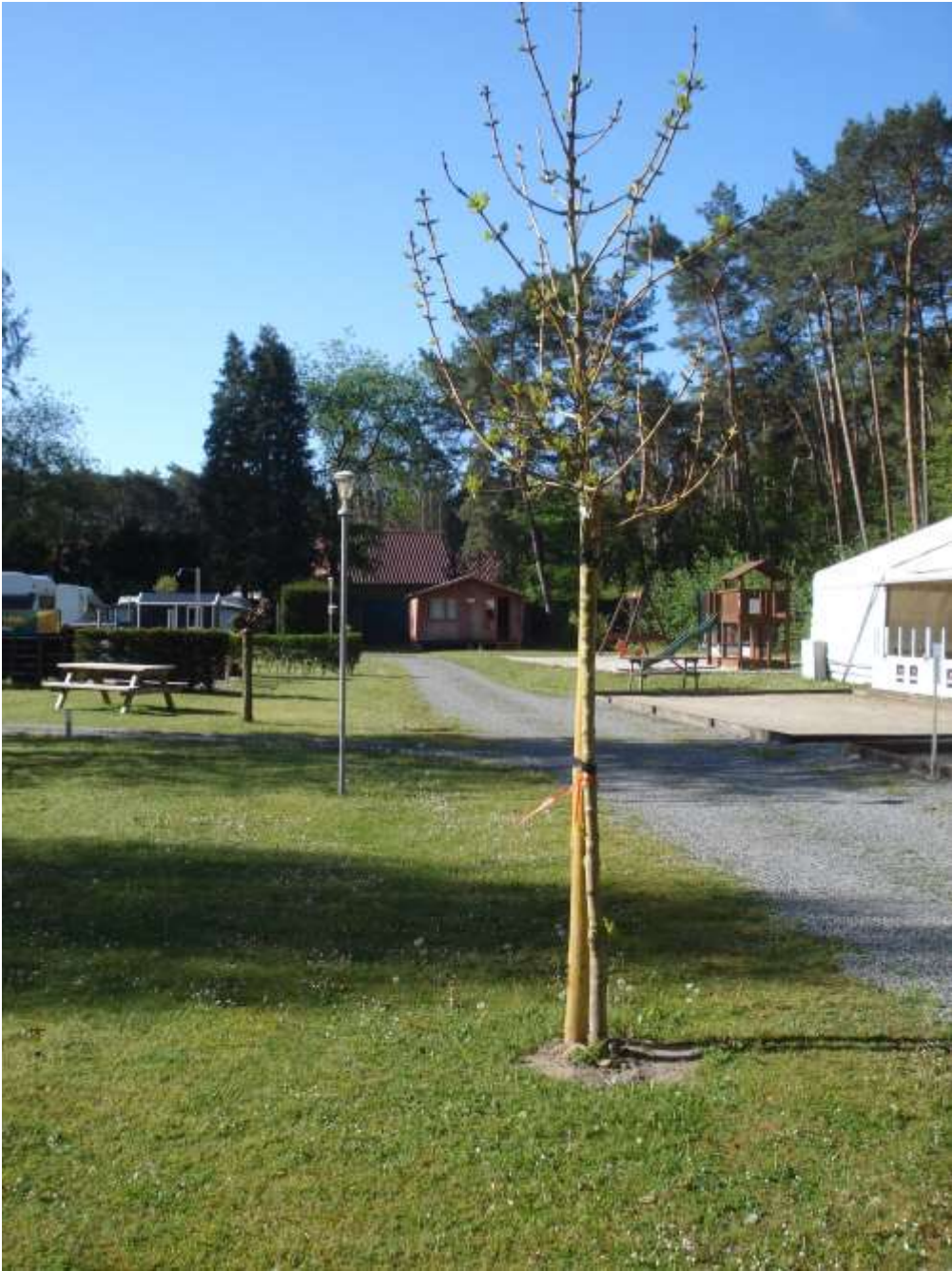
Chers jeunes naturalistes